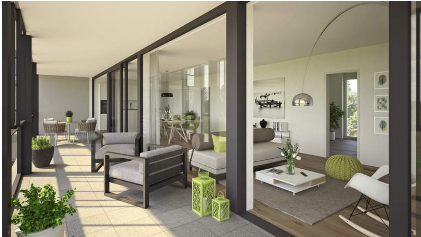
Wohnung OG rechts: Loggia Perspektive

UNSER ANGEBOT WIRD LAUFEND AKTUALISIERT. BESUCHEN SIE UNSERE WEBSITE: WWW.SWISSIMMOPRIME.CH