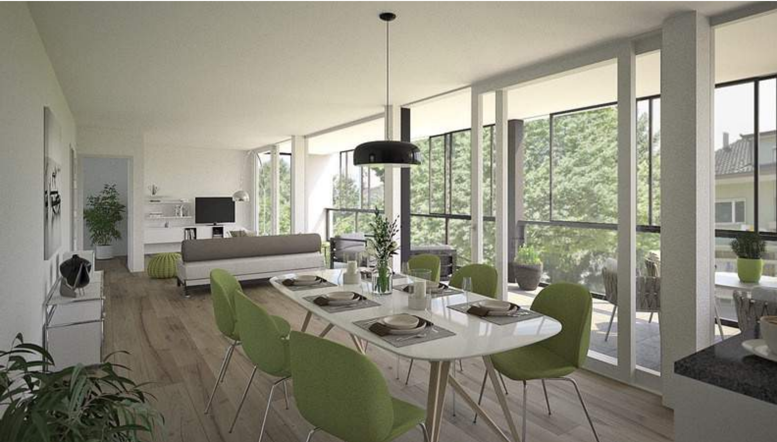
Wohnung OG rechts: Wohn- und Essbereich